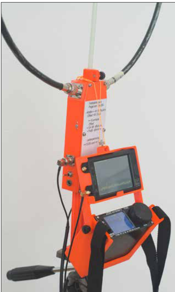
Abb. 3: Loop mit Trageeinrichtung, komplett bestückt mit dem RX ATS25 und dem TinySA

Nebst der kompletten Loop wurde auch eine komplette Trageeinrichtung für den Empfänger ATS-25 und den Tiny SA designt und konstruiert.