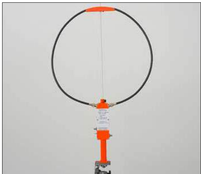
Abb. 1: Aktive Breitbandloopantenne

Auf Anregung der EMV-Fachleute der USKA [3] und auch aus eigenen Erfahrungen haben sich Erhard HB9CIZ und Hanspeter HB9CPT entschieden, eine für Amateurfunkbelange ausgerichtete Peileinrichtung zu entwickeln. Dabei zeigte sich bald einmal, dass dazu eine aktive Breitbandloopantenne die beste Wahl ist. Diese Antenne kann in Kombination mit einem kleinen Empfänger, wie z.B. einem ATS-25 [4] und mit einem TinySA [5] oder einem Empfänger mit Spektrumsanzeige, wie z.B. einem IC-705 [6] eine effiziente und präzise Auffindung von Störquellen ermöglichen. Nebst der akustischen Erfassung des Störers ist am TinySA oder am mobilen Empfänger mit Spektrumsanzeige auch eine Visualisierung des Störsignals möglich. Vielfach erkennt man damit auch sofort um was für eine Störquelle es sich handelt.